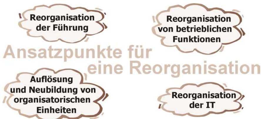
Abbildung 1 Ansatzpunkte für eine Reorganisation

Für eine Reorganisation im Unternehmen gibt es vier mögliche Ansatzpunkte: Man kann die Führung reorganisieren, betriebliche Funktionen anders gestalten, neue Organisationseinheiten bilden und alte auflösen sowie die bestehenden Informationstechnologien im Unternehmen modernisieren.