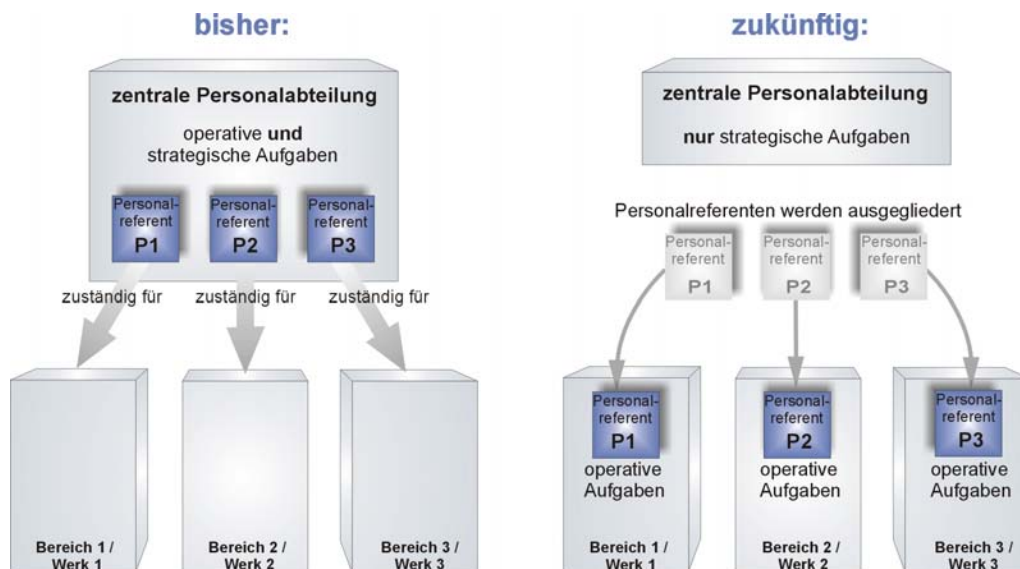
Abbildung 2 Reorganisation am Beispiel Personalreferentensystem

Daneben gibt es in der Unternehmenszentrale noch eine kleine und schlanke Personalabteilung, die sich ausschließlich um zentrale Aufgaben (z.B. Gehaltsabrechnung) kümmert und alle Grundsatzfragen regelt.